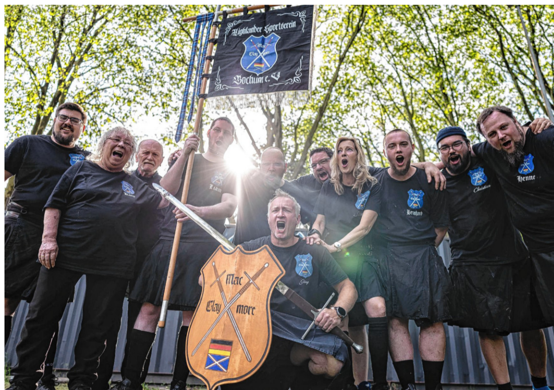
Das Team vom Verein „Mac Claymore“ aus Bochum.